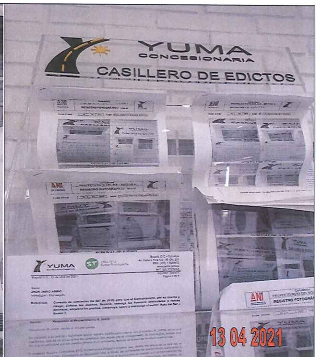
EDICTOS DE LA R_2638 YC-CRT-100477