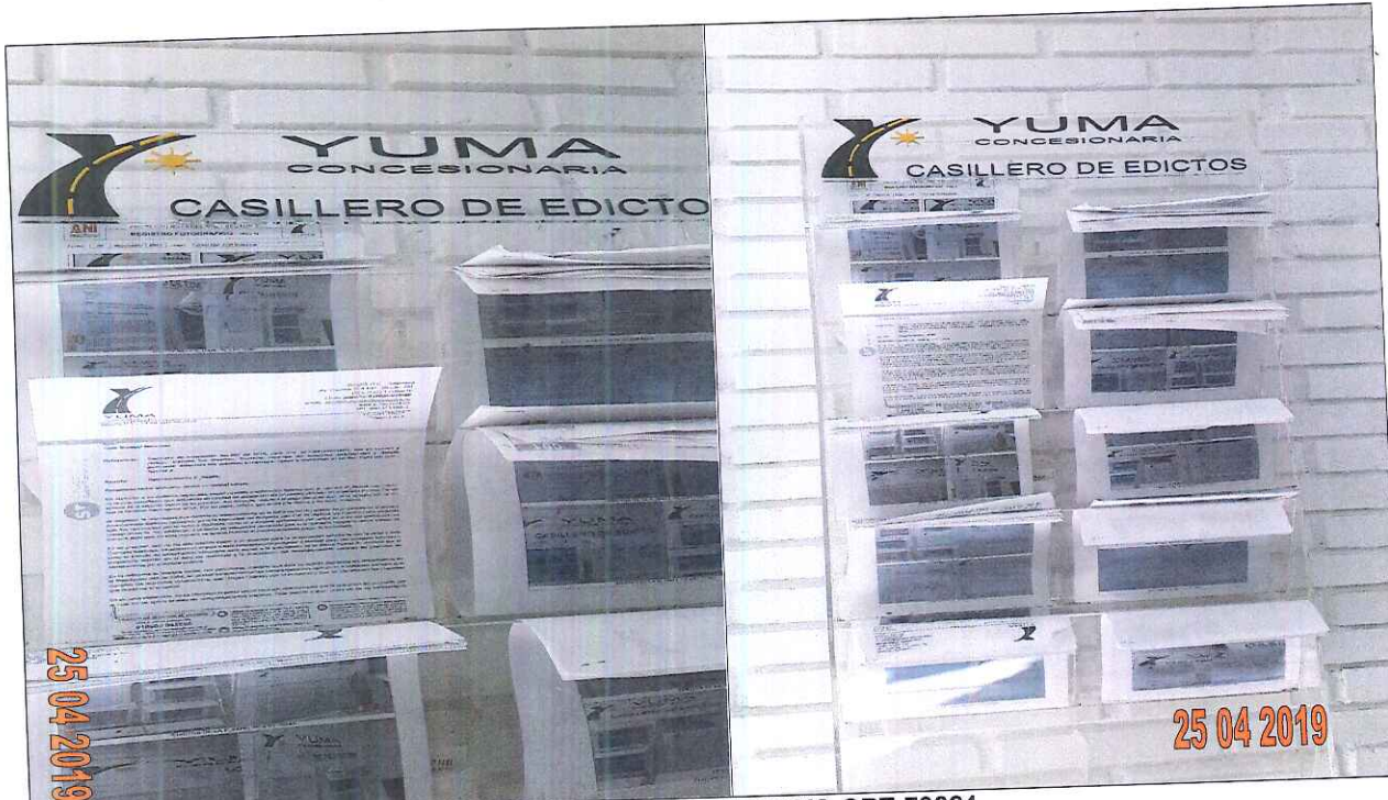
EDICTOS DE LA P_04808 YC-CRT-79324

Oficina de Atención Al Usuario, Bosconia